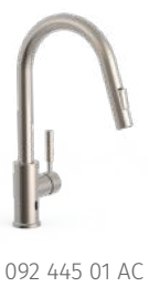
092 445 01 AC

El grifo funciona como un monomando convencional (accionando la maneta lateral) y también activándolo a través del sensor, que se encuentra detrás de la salida del caño.