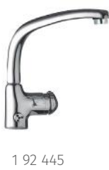
1 92 445